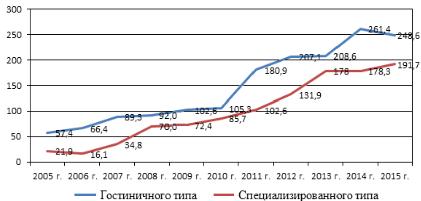
Рис. 3. Объем оказанных услуг КСР Республики Мордовия с 2005 по 2015 г., млн руб.

го анализируемого периода, был выше, чем организациями специализированного типа. В целом в 2015 г. КСР получили доходы от предоставления услуг в сумме 456,6 млн руб., в том числе за счет реализации путевок (курсовых) доходы составили 41,8 %, от продажи номеров — 51,3 %, от оказания дополнительных платных услуг — 6,9 %. По сравнению с показателями 2014 г. удельный вес доходов от реализации путевок упал (составлял 45,3 %), а от продажи номеров — вырос (был 47,8 %) 13 .