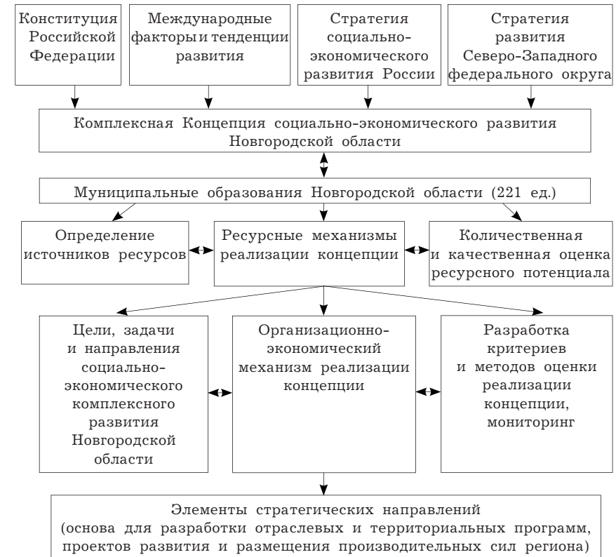
Рисунок. Организационно-методическая и структурная схема долгосрочной концепции стратегического комплексного социально-экономического развития Новгородской области

комплексного социально-экономического развития региона, так как она, являясь документом, включает определение стратегических целей развития региона и средств их достижения. В соответствии с назначением долгосрочная концепция комплексного социально-экономического развития региона содержит ряд блоков (рисунок).