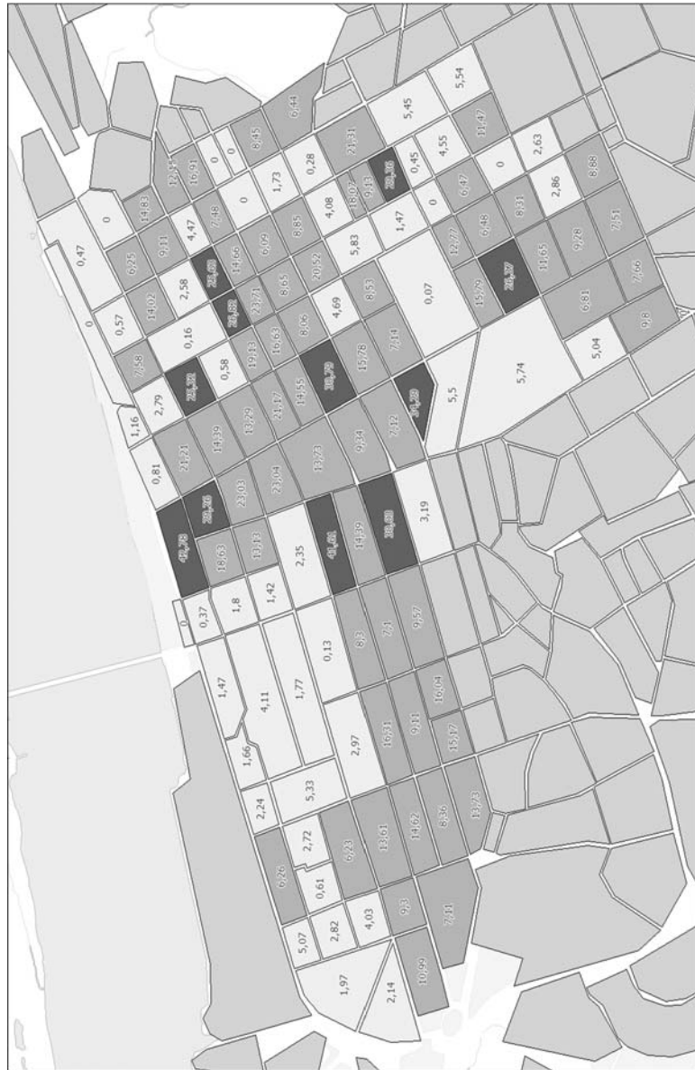
Рисунок. Картграмма плотности использования территории центра г. Перми

С учетом концепции «маркетинга территории» для прогнозирования дальнейшего пространственного развития города мы должны рассмотреть предлагаемые решения с точки зрения потенциальных так называемых «покупателей территории»: покупателей жилья, предпринимателей и арендаторов коммерческой недвижимости. Обеспеченные горожане предпочитают комфортабельные загородные дома, а для финансирования массового строительства нужны новые государственные подходы к долгосрочному кредитованию. Таким образом, непонятно, на какую категорию жителей рассчитаны предложения по увеличению плотности застройки центра города.