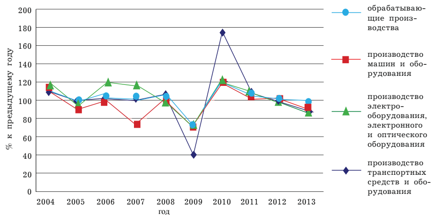
Рисунок. Динамика индекса производства Самарской области по отдельным видам экономической деятельности

Говоря о динамике индекса производства в машиностроительном секторе региона (рисунок), следует отметить прямую зависимость изменений показателя обрабатывающих производств от движения в подотраслях машиностроения: