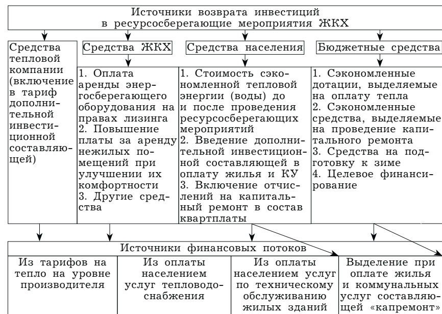
Рисунок. Источники возврата инвестиций в ресурсосберегающие мероприятия ЖКХ

Предлагаем схему финансовых потоков для финансирования ресурсосберегающих мероприятий (рисунок). Основным источником возврата инвестиций будут бюджетные средства. Для обеспечения возврата долгов, взятых на ресурсосбережение, может направляться часть средств местного бюджета, ранее предназначавшихся для финансирования развития и текущей деятельности предприятий ЖКХ и высвобожденных в результате реализации ресурсосберегающих проектов.