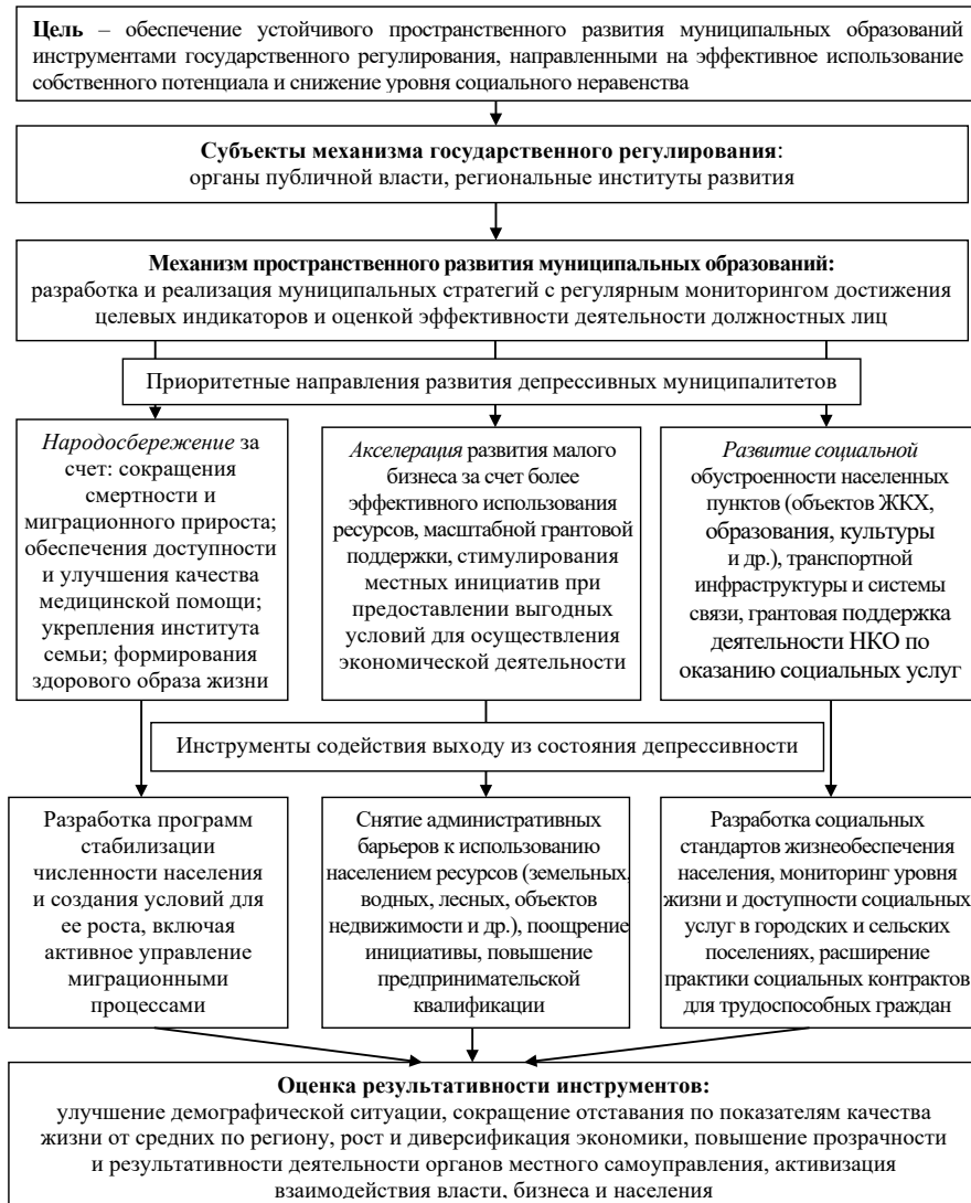
Р и с. 2. Механизм преодоления социально-экономического неравенства муниципальных образований за счет сокращения отставания депрессивных территорий