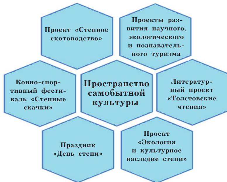
Рисунок. Состав мегапроекта «Пространство самобытной культуры»

рынков сельскохозяйственной продукции, сырья и продовольствия Самарской области» на 2014—2020 гг. 8